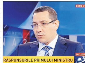
RĂSPUNSURILE PRIMULUI MINISTRU

necesarul participării pentru validarea Referendumului urală la, aproximativ, 9 milioane, ceea ce excede cu vreo jumătate de milion cifra participării la Referendum.