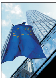
Banca Centrală Europeană - locul de unde vine vestea.

În primul rând, pentru că nu sunteți atașați noțiunilor de dicționar.