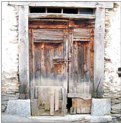
Evitați ușa din spate a altora! Vă invităm să intrați pe ușa din față la polemica din BURSA!