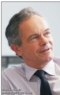
Andreas Treichl, președintele Erste Group

O mare bancă din China se află în negocieri de colaborare sau posibilă preluare cu Erste Bank Austria, ne-au declarat surse apropiate situației. Unii susțin că discuțiile ar viza realizarea unui parteneriat al Erste Group cu una dintre cele mai mari bănci chineze, în vederea facilitării operațiunilor acesteia în Europa Centrală și de Est (ECE). Instituția financiară chineză ar urma să deruleze tranzacții în regiune prin intermediul Erste, care i-ar servi drept un liant.