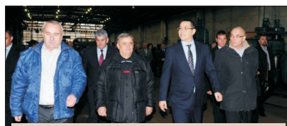
Premierul Ponta alături de primul sectorului 2, Neculai Onțanu (în stânga, lângă premier) și vicepremierul Gabriel Oprea (în spate, lângă primul Onțanu)

Domnia sa ne-a declarat că Blue Diamond Estate este unul din creditorii de la Aversa, motiv pentru care, potrivit prevederilor legale, firma câștigătoare nu poate să aducă de bunăvoie oferte spre vânzare la o valoare mai mică de 75% din prețul de pornire a primei licitații. Cu toate acestea, Aversa a fost vândută la aproximativ jumătate din prețul de pornire, respectiv 17,3 milioane