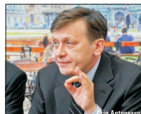
mestru doi cu 5%, decât cu 3%, la începutul anului.

Liderul PNL Crin Antonescu a afirmat ieri că bugetul pentru anul viitor ar permite scăderea contribuțiilor de asigurări sociale cu 3% încă din ianuarie. Domnia sa susține că experții FMI, veniți la București, "se înșală" atunci când susțin că nu era posibilă reducerea CAS de la începutul anului viitor. Crin Antonescu a recunoscut că, într-adevăr, este preferabilă reducerea CAS din se-