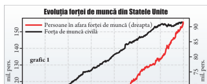
Evoluția forței de muncă din Statele Unite grafic 1