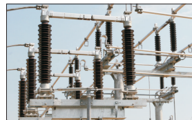
Acum s-a întors roata. Operatorii își vând greu energia pe piețele OPCOM. Scăderea puternică a consumului și intrarea în piață a peste 2.000 MW colieni cu preț foarte mic i-au determinat pe producători să se bată să livreze cât mai multă energie pe piața reglementată pentru anul viitor, susțin surse din ANRE.

Piața reglementată de energie era, în anii trecuți, speriotoarea producătorilor, care nu au fost deloc încântați de prețurile mici stabilite de reglementator (ANRE) pentru cantitățile importante de energie pe care au fost obligați să le livreze populației și micilor agenți economici.