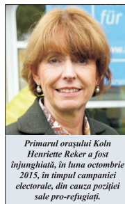
Primarul orașului Köln Henriette Reker a fost înjunghiată, în luna octombrie 2015, în timpul campaniei electorale, din cauza poziției sale pro-refugiați.

Z eci de femei au fost agresate sexual și jefuite, de Anul Nou, la Köln, în zona Gării Centrale, de aproximativ o mie de refugiați, care i-au atacat pe cetățenii care ieșiseră în stradă ca să sărbătorească intrarea în Noul An sau care treceau prin zăvoi, potrivit preselor germane. Astfel de incidente au avut loc și la Hamburg sau Stuttgart.