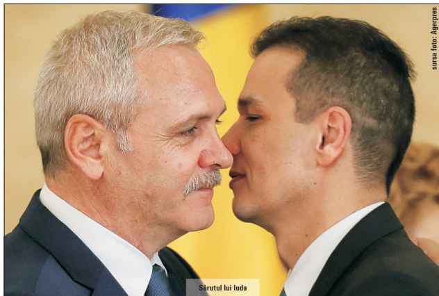
Sărutul lui Iuda

Nu era clar nimic, la închiderea ediției.