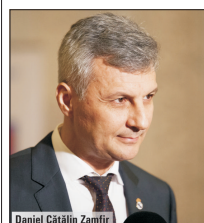
Daniel Cătălin Zamfir

● Zamfir: "Inițiativa legislativă va reglementa și executările silite"