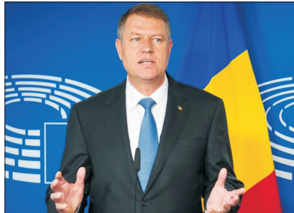
Președintele Iohannis are nevoie de un instrument special cu care să îmblânzească "demonii pădurii" care-i pot tulbura liniștea și amenința siguranța, are nevoie de o înțelegere pe care nu a dobândit-o încă, dar la care ar putea accede prin trecerea probelor tăcerii, apeii și focului! În spațiile fiecărei porți, stă un alt fel de viitor pentru România și politica ei.

DUPĂ CE TRIBUNALUL A AMÂNAT, DIN NOU, CONFIRMAREA NOII METODE DE VÂNZARE