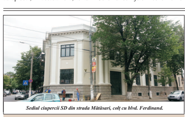
Sediu cliperci SD din strada Mătăsari, colț cu Blvd. Ferdinand.

În acest context, europarlamentarul Teodor Stolojan ne-a spus că următorii pași pe care ar trebui să-i facă țara noastră pentru recuperarea banilor datorati de Cuba ar fi: "Ministerul Finanelor trebuie să dea o declarație publică despre mărimea datoriei Cubei față de România la momentul 31 decembrie 1989 și la momentul desființării CAER (n.r. Consiliul de Ajutor Economic Recipro-