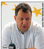
plângi sau să râzi. Rămâi blocat. Toma Petcu, însă, nu își pune întrebări, el debitează prostii cu nonsalan-

D acă Ministrul Agriculturii Petre Daea stărneste amuzamentul prin discursurile înalțătoare despre oăde, Ministrul Energiei Toma Petcu pare să fie campionul gazelor. Sigur pe el, Ministrul Energiei a explicat, ieri, cum acțiunile societăților din portofoliul său nu ar fi trebuit să fie afectate de declarațiile Ministrului Finanelor Ionuț Mișa privind desființarea Pilonului II de pensii private, retractate ulterior din partea lui Toma Petcu este unul halucinant: pentru că societățile energetice nu au investiții în fondurile de pensii de pe Pilonul II. La așa o explicație, nu știți dacă să