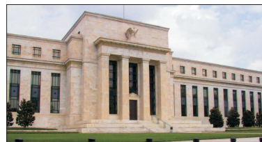
"Ideea că Federal Reserve reprezintă o componentă permanentă în economie este greșită". KEVIN WARSH, FOST GUVERNATOR AL FED

"Modelele sale nu sunt de încredere, politicile sunt eratiche, iar ghidarea în avans provoacă confuzie", scria, în august 2016, Kevin Warsh, fost guvernator al Federal Reserve, despre cea mai importantă bancă centrală din lume. În articolul publicat pe site-ul Hoover Institution, Warsh mai arată că "Fed-ul tratează adesea piețele financiare ca pe niște fiare care trebuie îmblânzite, ori ca pe niște pui care trebuie îngrijiiți sau ca pe o piață care trebuie manipulată". Kevin Warsh a ocupat diferite posturi, inclusiv de conducere, la Morgan Stanley între 1995 și 2002, iar apoi a devenit consilier economic al președintelui George W. Bush până în 2006, când a fost numit membru al Consiliului Guvernatorilor la Federal Reserve. Warsh a demisionat în 2011 și a intrat în mediul academic, la Hoover Institution din cadrul Universității Stanford. Kevin Warsh este membru al Grupului celor 30 și a fost membru al Consiliului Director al Grupului Bilderberg. Recent, fostul guvernator și-a exprimat critica, în cadrul unei întâlniri organizate de Federal Reserve Bank of Dallas, până la un prag nevosimil pentru un fost membru al conducerii executive a Federal Reserve.