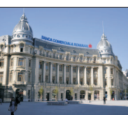
imobiliare din grup - BCR Real Estate Management SRL și Bucharest Financial Plaza SRL.

două dosare, în condițiile în care nu a fost de acord cu decizia acționarilor de fuziune a băncii cu societățile