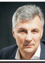
DANIEL ZAMFIR SENATOR PNL PREȘEDINTELE COMISIEI ECONOMICE

Înainte de a face câteva observații la declarațiile domnului Adrian Vasilescu, Consultant de Strategie la BNR, cer să mi se răspundă public de către Guvernatorul BNR la următoarele întrebări: 1. Este adevărat că, în România, băncile locale sunt pe primul loc în topul celor mai profitabile din UE, rentabilitatea fiind de două ori peste media europeană? 2. De ce costurile la credite în România sunt duble față de alte țări din UE? 3. Considerați normală marja dobânzii cu 6-8% peste Robor la împrumuturi de nevoi personale (deci 8-10%), în condițiile în care băncile plătesc sub 1% la depozite? 4. Considerați legitimă dorința cetățenilor și companiilor din România să acceseze împrumuturi cu costuri similare celor din țări precum Germania, Franța, Austria, Olanda, Belgia și altele? 5. Este adevărat că țări precum Germania, Franța, Spania, au limitat dobânzile remuneratorii și penalizatoarele atunci când climatul de afaceri și educația financiară nu au manifestat suficiența așteptată? 6. Este adevărat că azi avem în vigoare OG 13/2011 care introduce limitări în ceea ce privește dobânda remuneratorie și cea penalizatoare care, ciudat, nu se aplică și în relația creditorilor bancari și nebancari – persoane fizice?