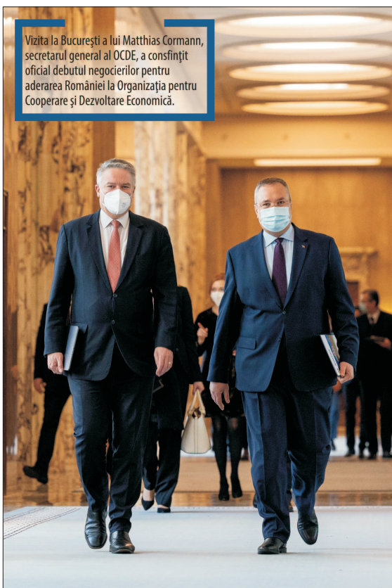
Vizita la București a lui Matthias Cormann, secretarul general al OCDE, a consfințit oficial debutul negocierilor pentru aderarea României la Organizația pentru Cooperare și Dezvoltare Economică.

Analizele tehnice vor acoperi o gamă largă de politici și se vor concentra pe probleme prioritare, inclusiv