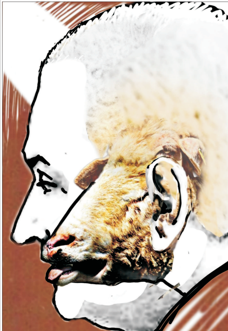
Profilul necesar pentru angajarea ca supraveghetor de piața financiară