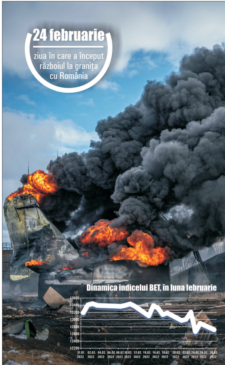
Dinamica indicelui BET, în luna februarie

24 februarie ziua în care a început războiul la granița cu România