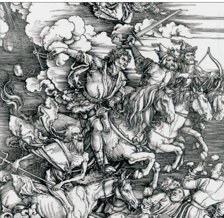
"Cei patru călăreți ai Apocalipsei" - gravură în lemn realizată în 1498 de Albrecht Dürer (1471-1528).