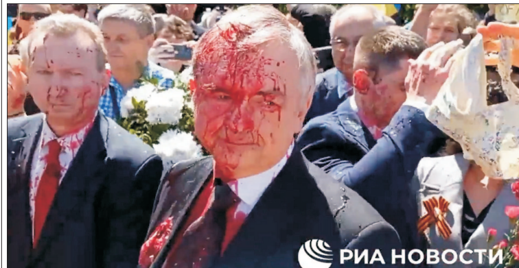
Ambasadorul Rusiei în Polonia, Serghei Andreiev, a fost stropit ieri cu o substanță roșie de manifestanți pro-ucraineni, la o ceremonie de la Varșovia, destinată Zilei Victoriei.

● Președintele Comisiei Europene, Ursula von der Leyen, susține renunțarea la votul în unanimitate și modificarea tratatelor UE, dacă va fi necesară ● 13 state membre, printre care și România, se opun modificării ● Emmanuel Macron vrea convocarea unei convenții de revizuire a tratatelor UE