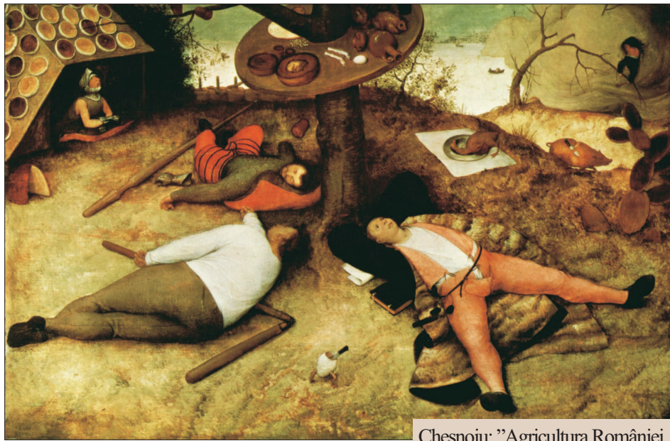
"Tărâmul leneșilor" / "Het Luielckerland", (1567) - Pieter Bruegel cel Bătrân (1525/1530-1569)

Oamenii pot renunța la foarte multe lucruri (inclusiv la libertate), dar încă nu există o soluție universal valabilă prin care se pot lipsi de aer, apă, hrană... Războiul din Ucraina a tras mai multe semnale de alarmă, iar acum Europa își reamintează prioritățile. Apă și aer, încă, există. Hra-