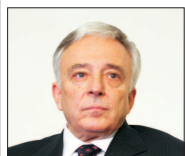
MUGUR ISĂRESCU, GUVERNATORUL BNR:

“Asta mai trebuie, să avem și o depreciere importantă a cursului”