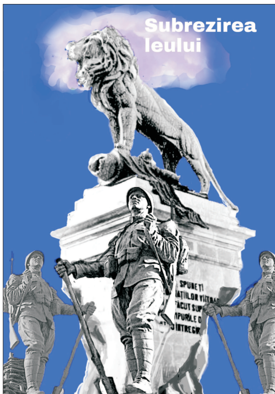
Ilustrație de MAKE

În data de 17 iulie, euro a coborât la o valoare de 4,9390 lei, față de 4,9408 în ședința de vineri, 15 iulie, apreciere de asemenea explicată de anumite intrări de