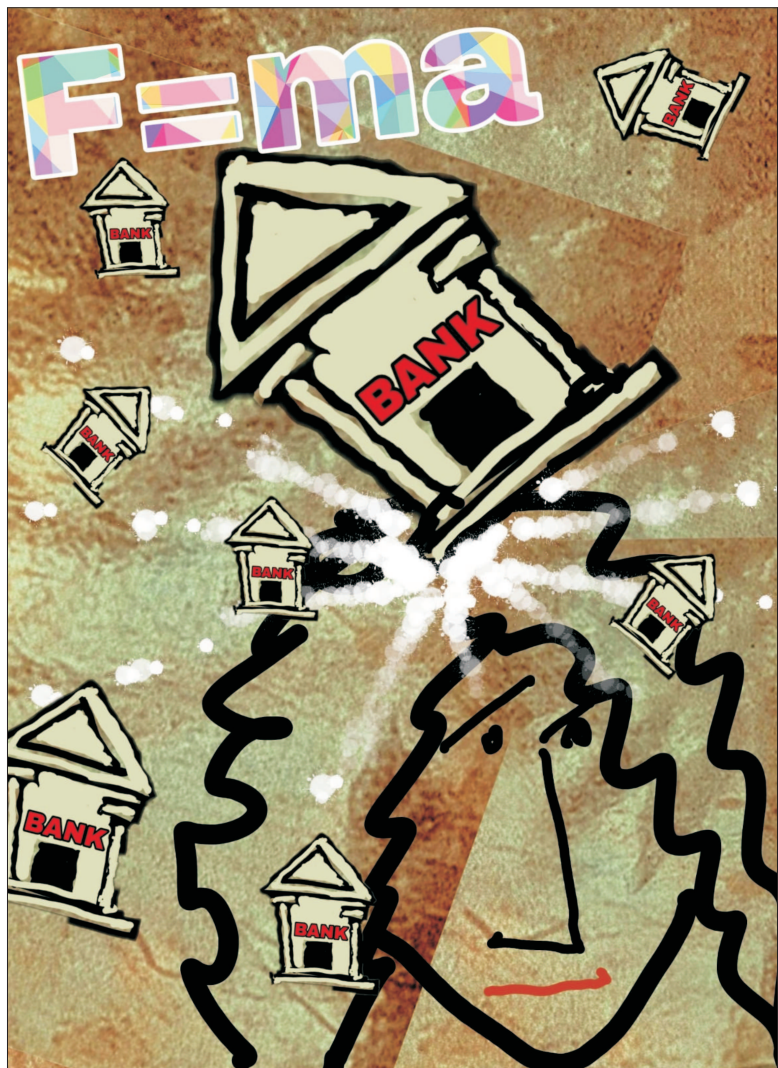
Gravitația băncilor / Desen de MAKE

● Titlurile Credit Suisse au coborât cu peste 30% pe parcursul sesiunii de ieri, după ce acționarul majoritar al băncii elvețiene a informat că nu îi mai poate furniza sprijin financiar acesteia ● Euro - în cel mai puternic declin de după martie 2020, față de dolar