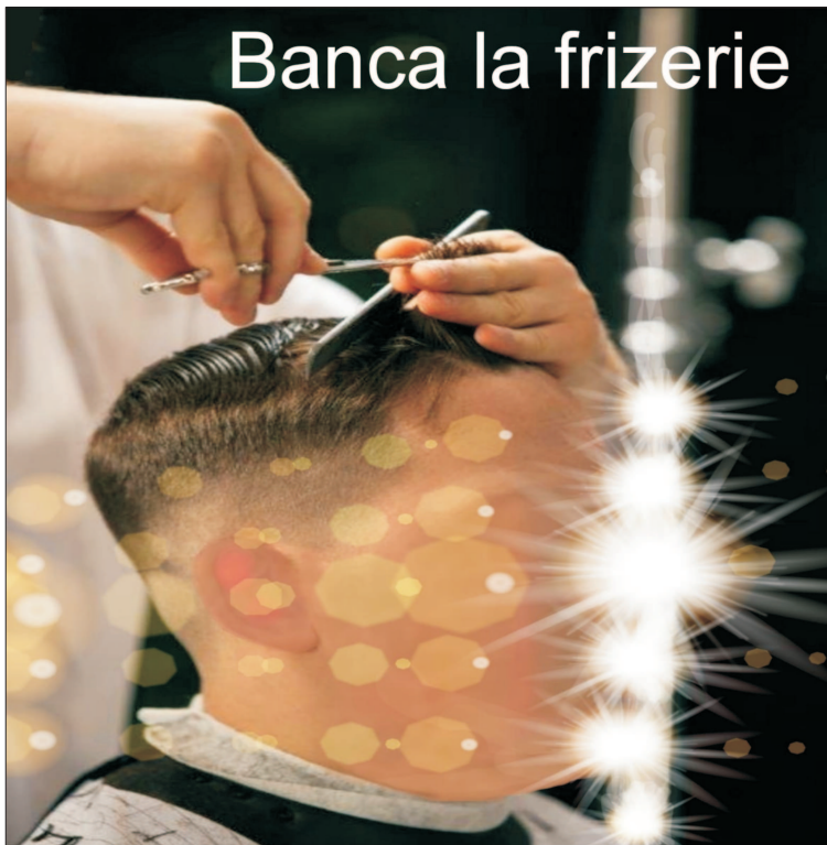
Ilustrație de MAKE