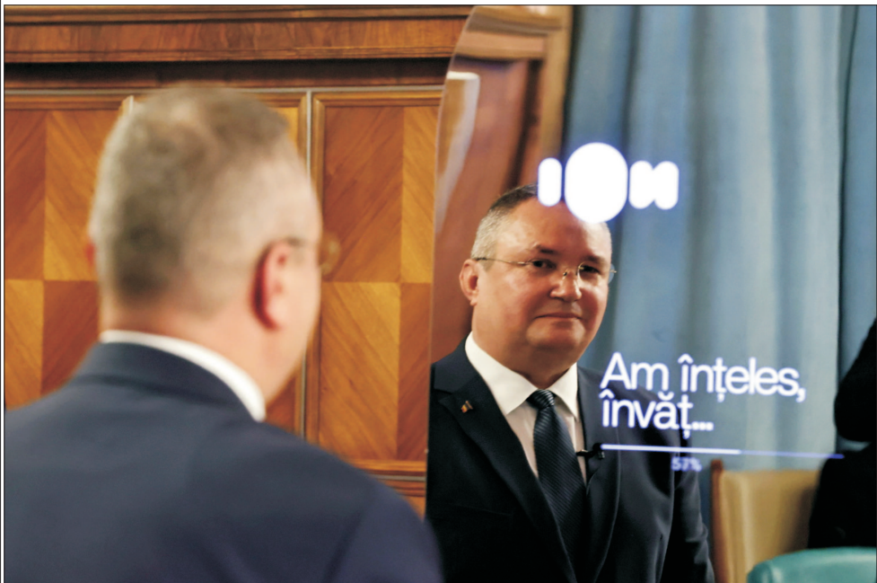
Premierul Ciucă, de vorbă cu Inteligența Artificială, pe care a numit-o consilierul Ion

P remierul Nicolae Ciucă și-a programat să demisioneze, astăzi, după cum a anunțat în urmă cu două zile, urmând ca primul guvern al coaliției PSD-PNL-UDMR să își încheie, astfel, activitatea, iar în primele zile ale lunii iunie să fie înlocuit de Cabinetul Cioloac.