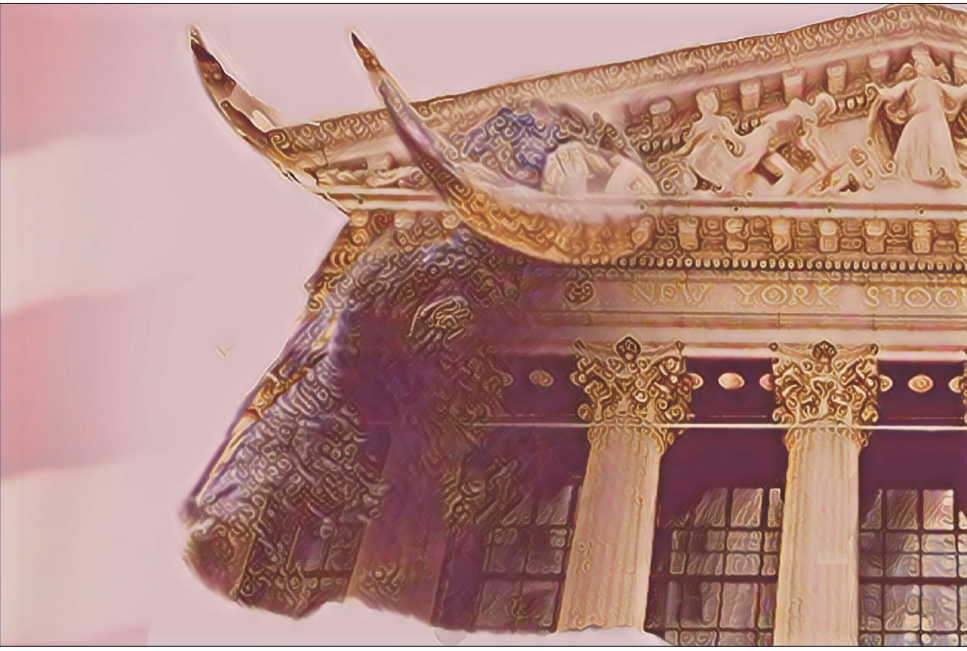
Grafică de MAKE