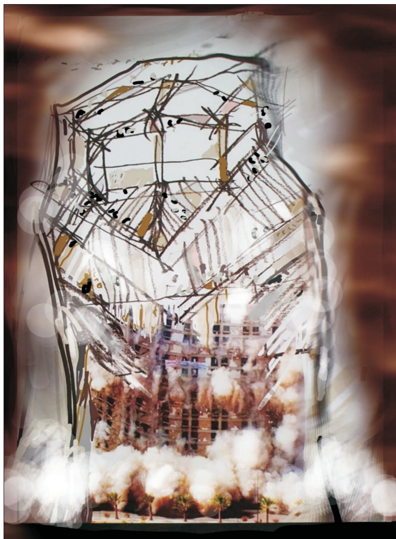
Clădire în demolare. Grafică de MAKE