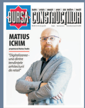
iulie-august 2023 Numărul 5 al revistei

Reforma electorală adoptată de Parlamentul European - blocată de statele membre UE PAGINA 3