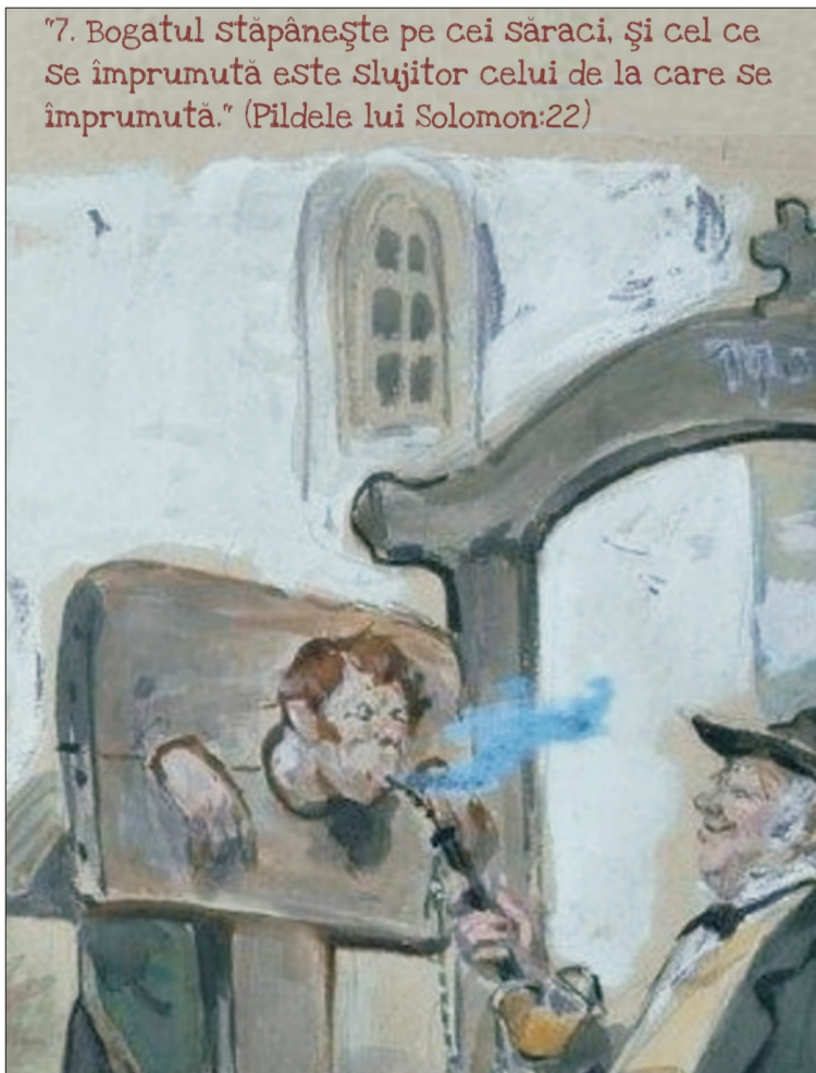
Acuarea de Nils Nilsen Bergslien (1853-1928), pictor norvegian

"7. Bogatul stăpânește pe cei săraci, și cel ce se împrumută este slujitor celui de la care se împrumută." (Pildele lui Solomon:22)