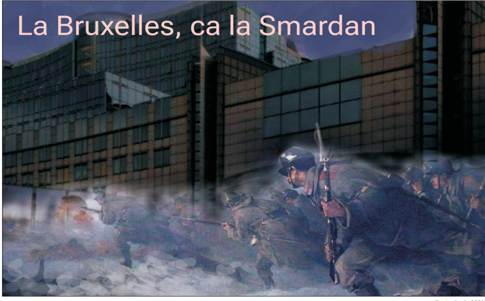
Ilustrație de MAKE

● 7,2% dintre funcționarii europeni debutanți sunt din România ● 3,76% din personalul cu atribuții de conducere din cadrul Comisiei Europene și al altor instituții UE este alcătuit numai din români ● Salariul minim lunar pentru un funcționar debutant se apropie de 5.000 de euro