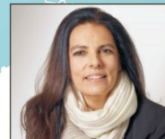
2. Françoise Bettencourt Meyers, Franța, 80,5 miliarde $