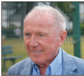
5. Francois Pinault, Franța, 40,1 miliarde $