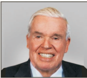
6. Klaus Michael Kühne, Germania, 39,1 miliarde $