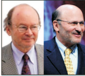
9. Alain Wertheimer și Gerard Wertheimer, Franța, câte 31,6 miliarde $