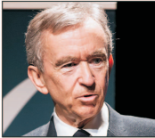
1. Bernard Arnault, Franța, 211 miliarde $