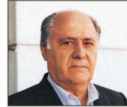
3. Amancio Ortega, Spania, 77,3 miliarde $