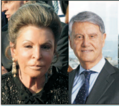
10. Rafaela Aponte Diamant și Gianluigi Aponte, Elveția, câte 31,2 miliarde $