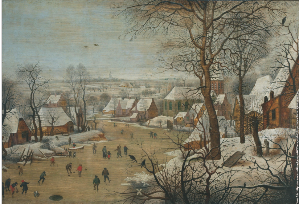
Pieter Bruegel cel Tânăr (1564-1638) - Winter Landscape with a River/Peisaj de iarnă cu un râu (1615-1620)

ostalgia are sensul ei, până la un punct, acela în care se leagă de niște vremuri pe care nu le-ai trăit. Există riscul să te duci într-o zonă de ridicol. Dacă te plângi două zile pentru că te-a călcat cineva pe picior în tranșivă, nu e cazul să trâmbezi că fi-ai fi dorit să trăiești în evul mediu, în timpul cavalerilor rădicatori. Să revenim la nostalgie și la un trecut "mai apropiat". Trecuser ușor de prima jumătate a anului 80, indiferent de anotimp, un ceva de un gri greu apăsa peste majoritatea oamenilor. Neajunsurile se înșirau într-un ritm auriu, nu exista aproape nimic care să fie de primă necesitate, care să nu lipsească. Urmasul o paranteză (aceasta este pentru calmarea nostalgicilor de alt tip, da, e de adevărat, toată lumea avea loc de muncă, atât). Orcel ar fi fost gri-ul de gri, mulți aveau un vis, aproape tangibil, un televizor color. E greu de explicat acum cât