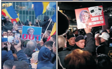
Poziția PPE - înăuntru, opoziția PPE - afară