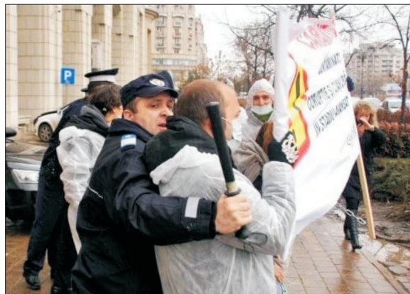
Protestele din 2012, fotografie de arhivă

Instanța de arbitraj internațional privind investițiile străine a decis, vineri, să dea câștig de cauză statului român în procesul intențat de compania canadiană Gabriel Resources privind stoparea de către autoritățile de la București a investiției în cariera de la Roșia Montană. Decizia instanței arbitrale este una surprinzătoare, în condițiile în care, de la finalul lunii ianuarie încoace, reprezentanții guvernului Cioloac și unii lideri politici au afirmat în dese rânduri că se simțea ne va fi defavorabilă și că vom fi nevoiți să plătim despăgubiri cuprinse între 2,5 miliarde și 6,7 miliarde dolari.