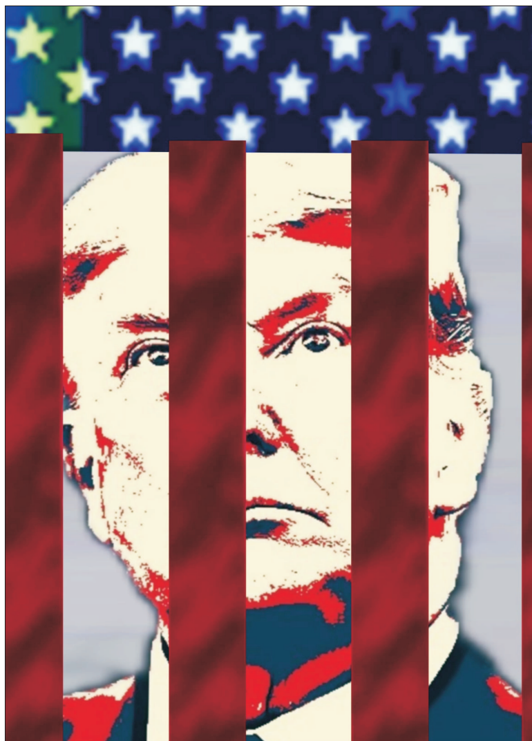
Ilustrație de MAKE

J oi, 30 mai, un juriu din New York l-a găsit pe fostul președinte Donald Trump vinovat pentru toate cele 34 de acuzații de falsificare a dosarelor comerciale. Este pentru prima dată în istorie când un fost președinte al SUA a fost condamnat pentru o infracțiune.