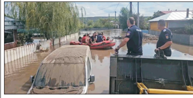
Mii de persoane au fost evacuate din calea apelor, în timp ce echipele de intervenție continuau să salveze oameni din zonele inundate.

Lumea stă sub semnul inundațiilor. Necazurile curg șuvoi din Europa până în Asia. Furtuna Boris a adus haos și suferință în Europa Centrală și de Est, lăsând în urma sa victime și pagube materiale uriașe. Această furtună puternică a afectat mai multe țări, printre care Au-