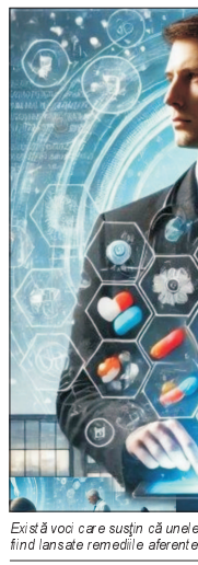
Există voci care susțin că unele boli sunt create artificial, concomitent fiind lansate remedii aferente acestora. (Ilustrație: colaj de MAKE)

Mai multe publicații franceze și germane susțin că industria farmaceutică a extins artificial sfera bolilor, concentrându-se pe probleme cronice și sexuale, diabetul și colesteroul fiind două exemple clasice.