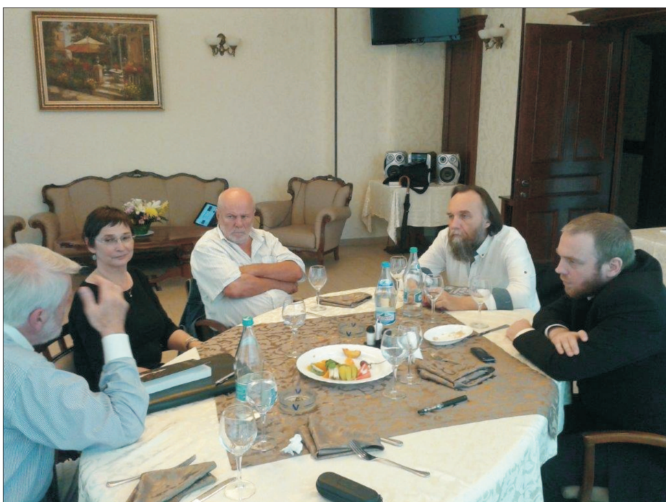
Întâlnirea lui Dughin cu un cerc restrâns de simpatizanți în anul 2014.

Germania va avea, în 23 februarie 2025, alegeri parlamentare anticipate, după ce ieri cancelarul Olaf Scholz a pierdut votul de încredere cerut Bundestagului. În urma unei dezbateri aprinse, parlamentarii germani au decis cu 394 de voturi împotriva, 207 voturi pentru și 116 abțineri, să nu mai acorde încredere guvernului Scholz, ceea ce marchează un moment istoric în politica germană, fiind prima dată în aproape 20 de ani când un cancelar pierde un astfel de vot. Procedura votului a fost una tensionată. Deputații au fost chemați să-și exprime poziția folosind trei tipuri de cartonașuri: albastru pentru „da”, roșu pentru „nu” și alb pentru „abținere”. Olaf Scholz însuși a votat, alegând simbolul cartonașului albastru, semnificând că își oferă propria încredere. După citirea rezultatului votului, președintele Bundestagului, Bärbel Bas a încheiat ședința declarând: „Am ajuns la finalul ordinii de zi - și al coaliției semafor”.